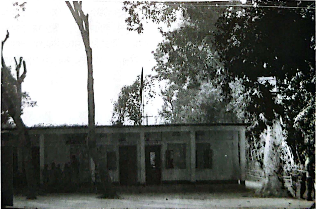
কৃষ্ণচন্দ্র সরকারি প্রাথমিক বিদ্যালয়